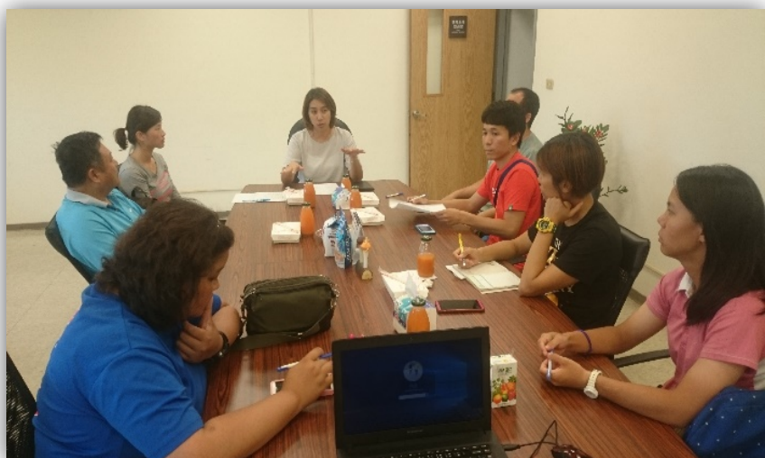
圖2. 校外教練訪談會議

召開校外教練訪談，參與之林口高中、壽山高中、觀音高中、平鎮高中、平鎮國中、會稽國中、仁和國中等老師、教練均表態願意合作這次的教練實習課程，亦給予一些意見。